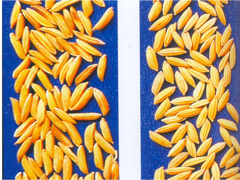
လက်ရွေးစင်